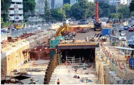
Proyek infrastruktur di Jakarta.