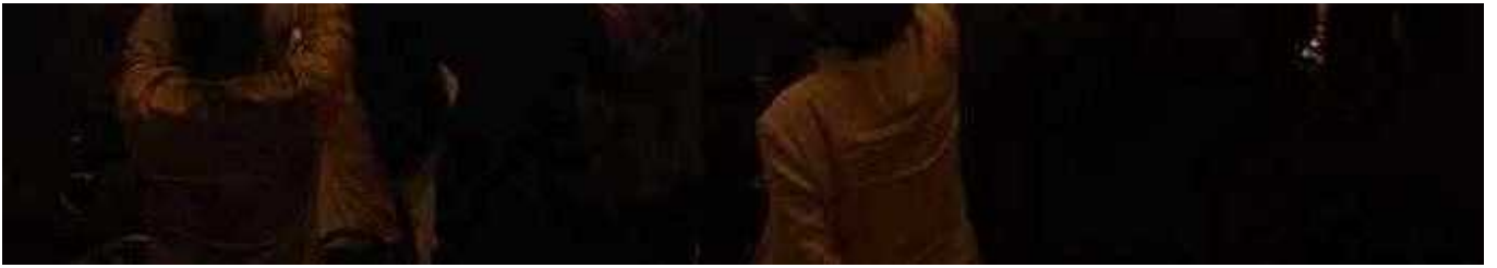
Suasana pelaksanaan "FIDIC International Infrastructure Conference 2107."

JAKARTA, BALIPOST.com – Konsultan memiliki peran yang strategis dalam menentukan datangnya investor, mengingat konsultan merupakan orang pertama yang dimintai pertimbangan sebelum investor melakukan investasi di suatu negara. Berkaitan hal tersebut, Inkindo sebagai asosiasi konsultan Indonesia mendukung sepenuhnya kehadiran investor internasional datang ke Indonesia sejalan dengan pembangunan berbagai infrastruktur yang dilaksanakan pemerintah dewasa ini.