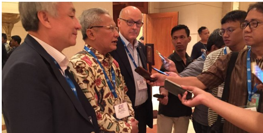
Ketua Asosiasi Konsultan Indonesia (Inkindo), Nugroho Pudji.

Merdeka.com - Konsultan merupakan salah satu pihak strategis dalam menentukan datangnya investor ke suatu tempat. Sebab, konsultan merupakan orang pertama yang dimintai pertimbangan sebelum investor tersebut menanamkan modalnya di suatu negara.